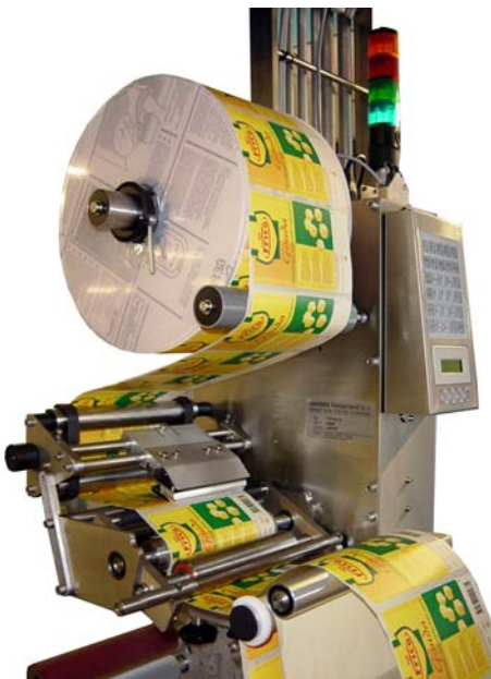
Een speciaal ontwerp. Printer t.b.v. Tiromat etiketteersysteem.