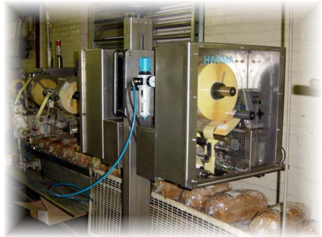
HASMA H700-TWIN in de praktijk.