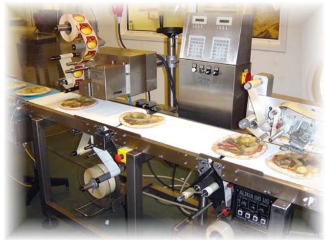
HASMA H628 onder- en bovenetiketteeropstelling.